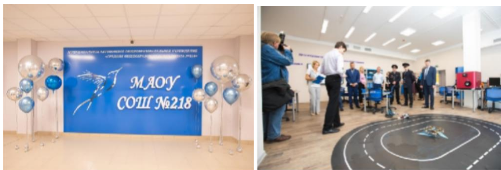
Рис.3. Организация предметно-пространственной среды MAOU СОШ №218

В школе работает централизованное аудиооповещение, это помогает вести радиозаписи, а также централизованно включать гимн Российской Федерации по понедельникам. На каждом этаже, в каждом корпусе располагаются сенсорные панели, по которым транслируются новости школы, социальные ролики, репортажи, итоги мероприятий. Так на первом этаже в холле располагается информационная сенсорная панель с электронным расписанием и новостной лентой, благодаря чему учащиеся легко могут найти необходимую информацию, а родители посмотреть все последние новости и учредительные документы.