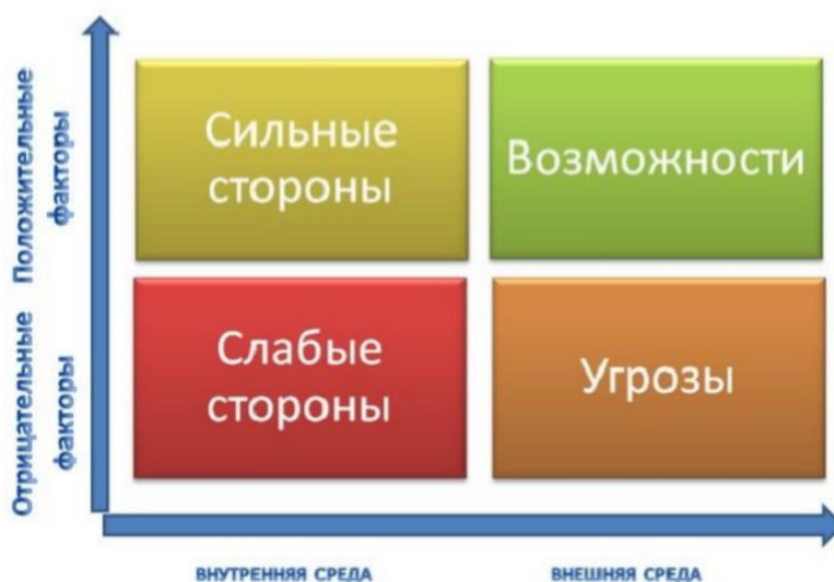
Рис.4. SWOT-анализ состояния воспитательной системы

Самоанализ осуществляется ежегодно. В качестве эффективного инструмента выбран SWOT-анализ состояния воспитательной системы МАОУ СОШ №218, который заключается в определении сильных и слабых сторон воспитательного процесса, с целью максимизировать благоприятные возможности и снизить возможные риски.