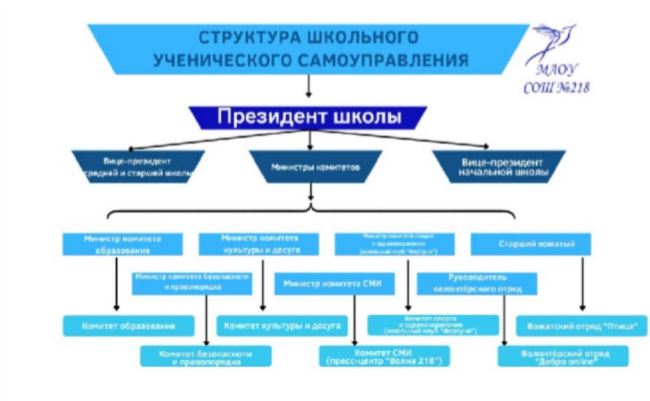
Рис.1. Структура школьного ученического самоуправления МАОУ СОШ №218

Основная цель института самоуправления учащихся в МБОУ «СОШ №72» заключается в создании условий для выявления, поддержки и развития управленческих инициатив обучающихся, принятия совместных с педагогами решений, а также для включения обучающихся школы в вариативную коллективную творческую и социально- значимую деятельность. Участие в самоуправлении даёт возможность подросткам попробовать себя в различных социальных ролях, получить опыт конструктивного общения, совместного преодоления трудностей, формирует личную и коллективную ответственность за свои решения и поступки.